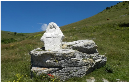
Madonna della Lobbia